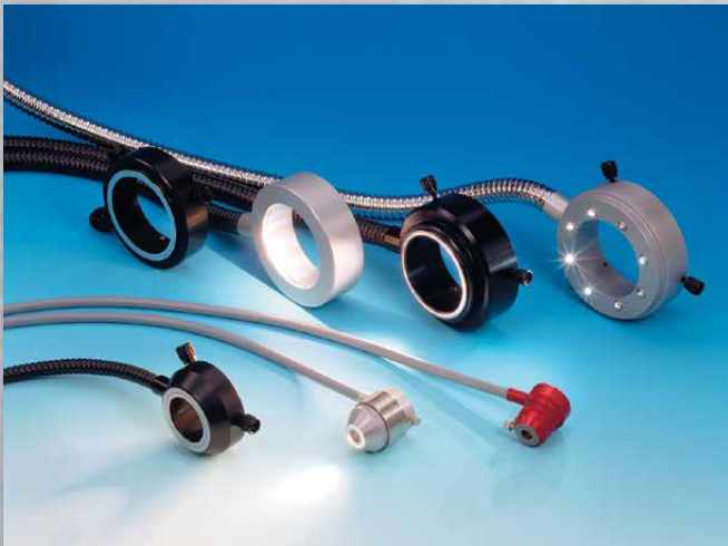
Faseroptische Ringbeleuchtungen Fiberoptic annular lights