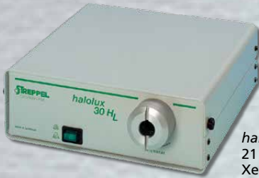
halolux HL 21 W / 35 W / 50 W / 100 W Xenon