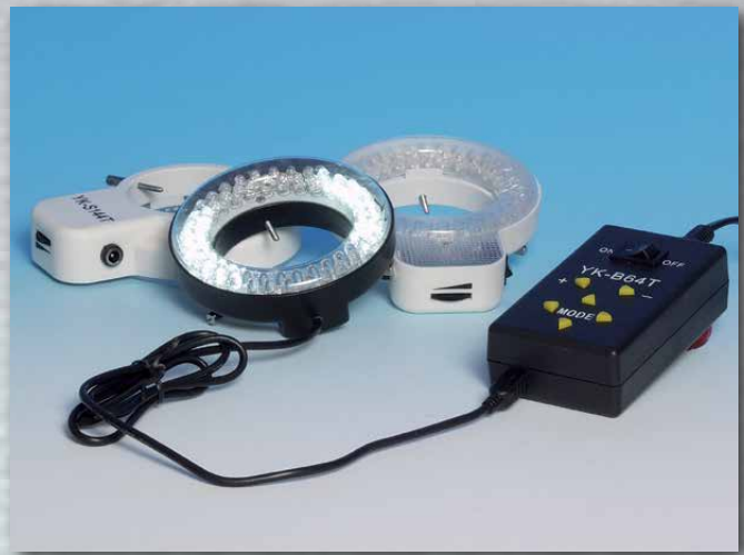
LED-Ringbeleuchtung LED annular light