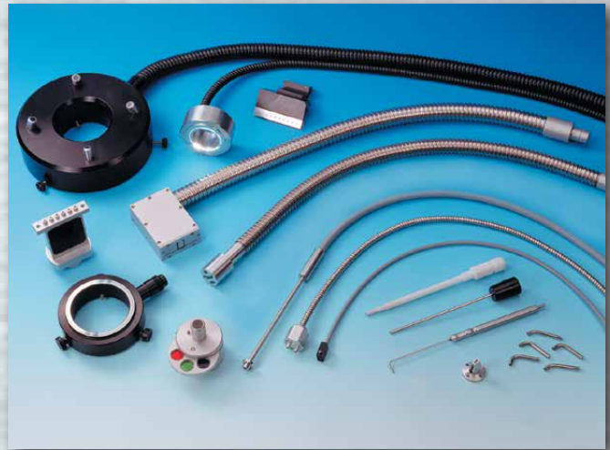
Spezial-Lichtleiter nach Kundenwunsch Special light conductors produces to customers' requirements