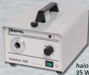
halolux 35 W / 90 W / 150 W Halogen