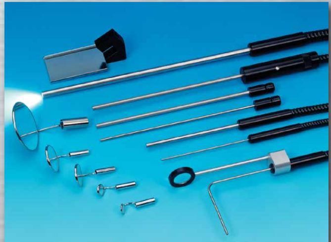
Inspektions-Lichtleiter Inspection light conductors