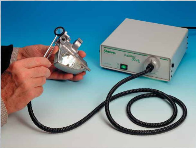
Miniscope-Prüfinstrument mit Lupe Miniscope testing instrument with magnifying glass